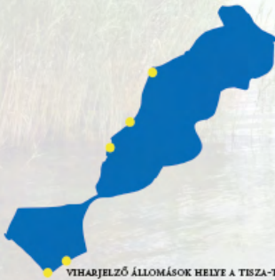
VIHARJELZŐ ÁLLOMÁSOK HELYE A TISZA-TAVON

A kiépített strandokon csónakkal felszerelt és képzett vízimentő teljesít szolgálatot. A nagyobb strandokon elsősegélynyújtó szolgálat is működik. Az általános segélyhívószám (112) lehet segítséget kérni.