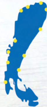
VIHARJELZŐ ÁLLOMÁSOK HELYE A FERTŐ-TAVON

A kiépített strandokon csónakkal felszerelt és képzett vízimentő teljesít szolgálatot. A nagyobb strandokon elsősegélynyújtó szolgálat is működik. Az általános segélyhívószám (112) lehet segítséget kérni.